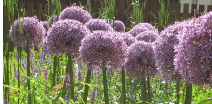
Zierlauch mit Frauenmantel